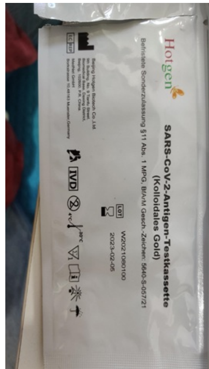
Testa kasetes dizains

Viltotajām testu kasetēm trešā iedaļa ir krietni mazāka nekā oriģinālajam testam.